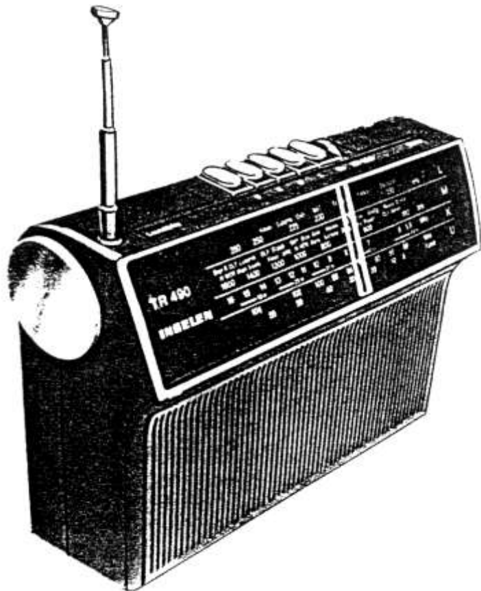
INGELEN TR 490

INGELEN TR 490 INGELEN TR 290 INGELEN Weltblick color ultrasensor 6446