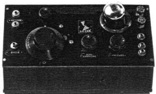
Audionempfänger ca. 1923/25

Wer kennt eine Firma mit dem Namen ZIK ZAK ? Oder wer kennt eine Firma, welche Apparate unter dem Markennamen ZIK ZAK baute?