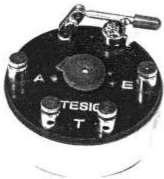
TESIG Detektor 1924

Legendär ist sein 1924 gebauter Detektorapparat, welcher in tausenden Exemplaren industriell hergestellt wurde, und kaum größer ist als eine Puderdose.